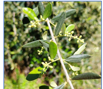
Mignole completamente estese, areale Garda