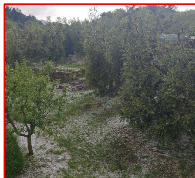
Accumulo di grandine a terra, Sebino